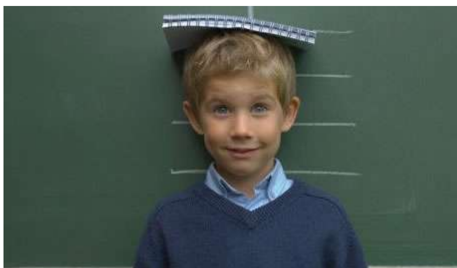
Obrázek č. 1: Jak správně měřit výšku dítěte