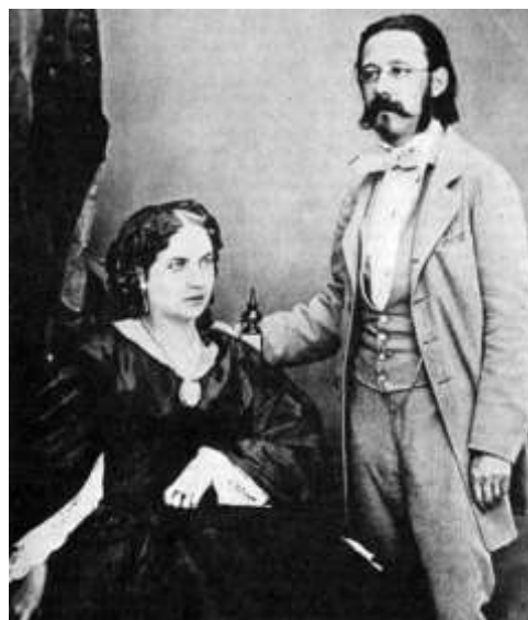
Obrázek č. 5: Nevšední zjev mladého Bedřicha Smetany