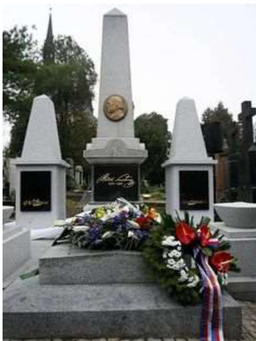
Obrázek č. 8: Hrob Bedřicha Smetany na Vyšehradě

Jeho intenzivní skladatelská práce pokračuje velkým Cyklem symfonických básní „ Má vlast“, i když počátkem osmdesátých let fyzických sil ubývá a zdravotní potíže začínají být neodbytné. Také skladatele velmi trápí myšlenka existenčních problémů své rodiny. Mou vlast dokončuje roku 1882. I když měla obrovský úspěch, přichází ke konci jeho života. V osmdesátých letech česká společnost hledí ke Smetanovi s obrovskou úctou jako k národnímu géniovi, ale on už žije v ústraní jabkenické myslivny, sužovaný náporů choroby. Umírá v Praze 12. května 1884. Jeho pohřeb 15.5. se stal národní smuteční slavností. S mistrem se loučily spolky, umělci, davy lidí. U Národního divadla naposled Smetanu pozdravily fanfáry a v tento den zde zazněla jeho Prodaná nevěsta. Skladatel je pohřben na památném Vyšehradě.