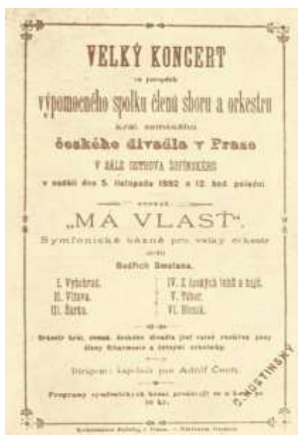
Obrázek č. 11: Plakát k prvnímu provedení Mé vlasti 5. listopadu 1882

Tento cyklus měl obrovský úspěch, ale přišel již ke sklonku skladatelova života.