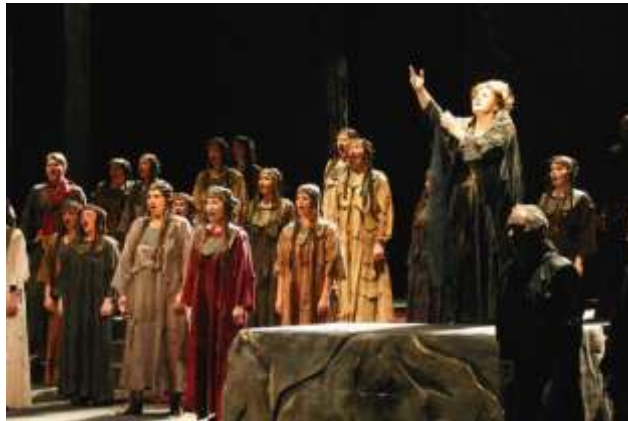
Obrázek č. 10: Představení Libuše v Národním divadle

Po jeho ohluchnutí vznikají další opery Hubička a Tajemství a Čertova stěna, ve kterých je znát zvláštní ovzduší těžké osobní krize. Jeho poslední, nedokončená opera je Viola.